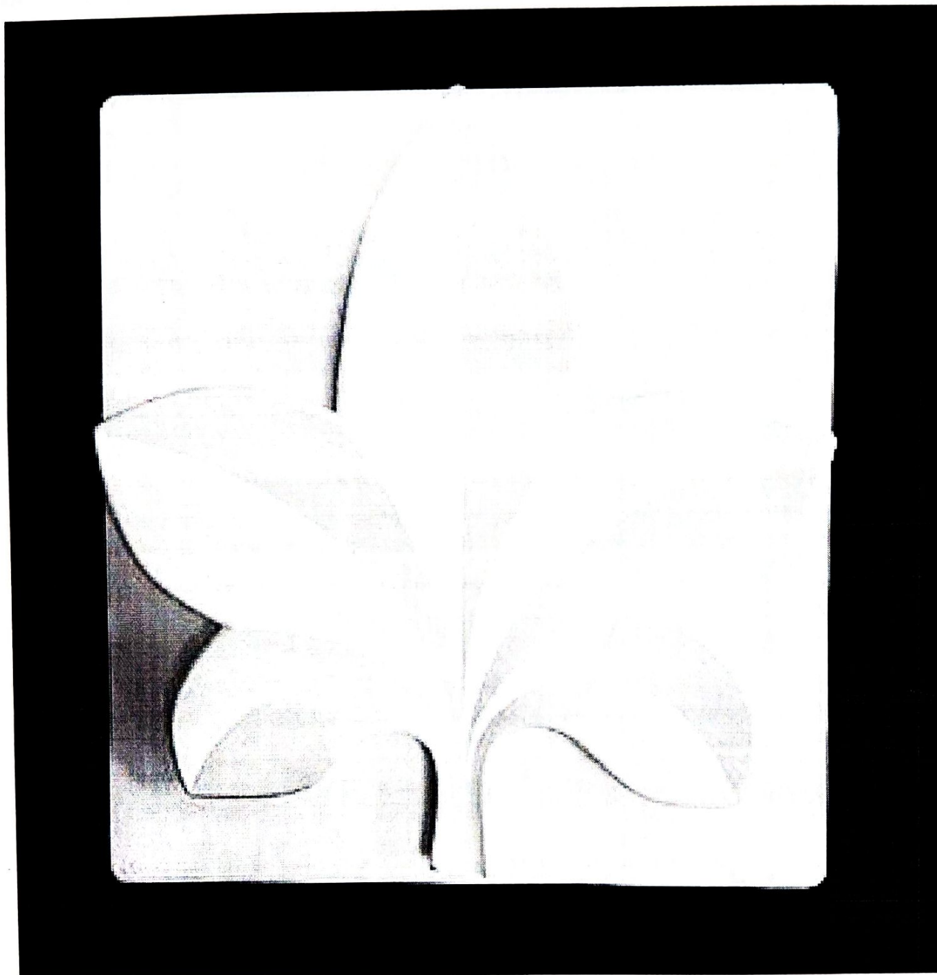
Рис. 1. Приклад гіпсової моделі